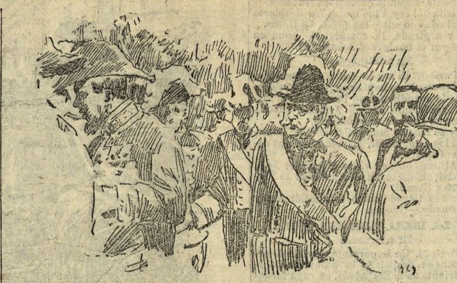
EL ENTIERRO DE SILVELA.—La presidencia del duelo

Ayer tuvo lugar la misa de Requiem por el alma de los fallecidos del cuerpo, y por la tarde se celebraron en el Parque Aerostático los festejos de la tropa, cuyo programa fué