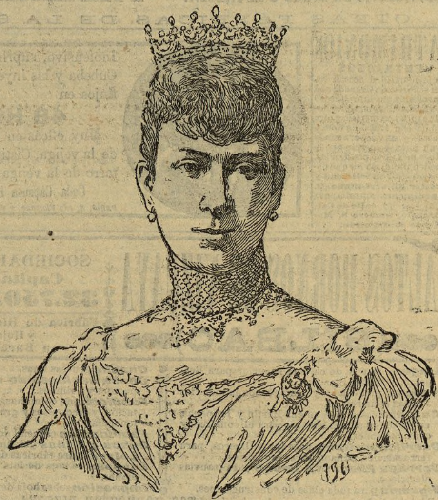
La princesa de Gales

INFORMACIÓN TELEGRÁFICA DEL DIARIO UNIVERSAL