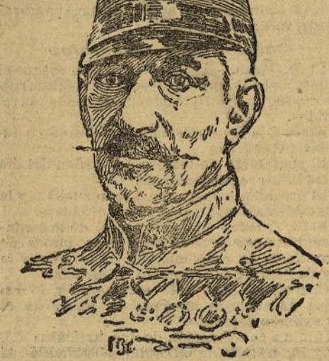
José Carlos Luis archiduque austriaco fallecido ayer en Fiume.

Otro despacho da cuenta de haber fallecido