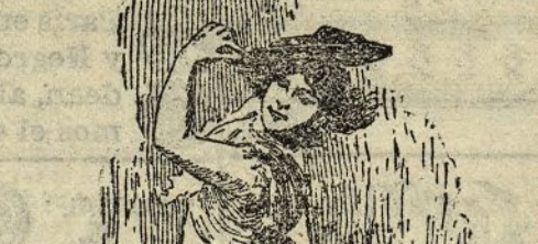
La bailadora "Imperio" cuadro de Villegas

Ocupa el centro de la composición la figura de la Paz, que besa a una bella mujer envuelta en la bandera norteamericana, sus