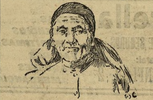
La mujer de más edad del mundo: ciento diez y ocho años

Lo más extraordinario, de entre los pensamientos que me ha sugerido la contemplación de