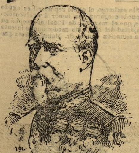
El general Azcárraga

De ninguna manera—se apresuró a responderlo el general con sinceridad vigorosa. Estaría yo loco de aceptar ahora una situación así. Estimo absolutamente indispensable