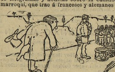
El último adiós a los tambores (Caricatura de Karan D'Ache)

Desdoble La Matin , y entre dos columnas de telegramas y noticias sobre la cuestión marroquí, que trae a franceses y alemanes a