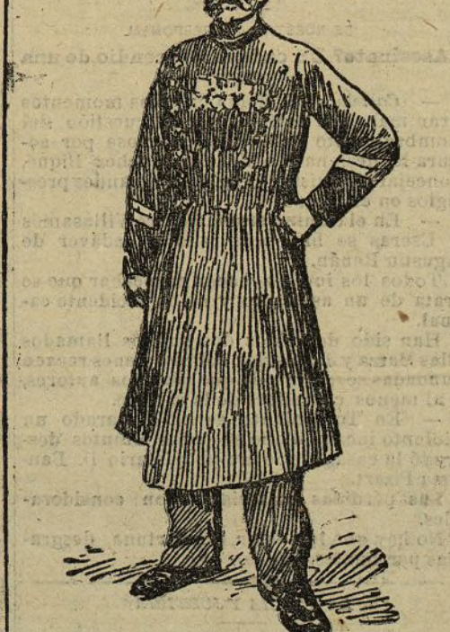
Un tambor mayor francés

—Ya habéis oído, granujas, la indirecta que acaba de dirigirme el coronel. Al que se equivoque le mato la porra por los morros.—F.