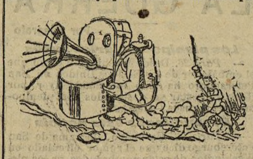
El aparato que sustituirá a los tambores en la guerra (Caricatura de Karan D'Ache)

Aquellos tambores mayores de marcial apostura, enorme morrión de pelo, blandidos en la diestra descomunal porra con la que mediante artísticos dibujos en el aire indicaban a sus satélites el tiempo en los redobles; los que cifraban su orgullo en tirar la porra por encima del antiguo Arco de la Armería al desfilar a paso lento en la parada, seguir sin preocuparse de los artísticos molinetes que aquella hacía en el aire y recogerla antes que tocara al suelo, una vez pasado aquello; los que algún calificado de payasos militares eran, sin embargo, los genuinos representantes de una legión de veteranos que a los redobles de sus cajas llevaban los tercios espa-