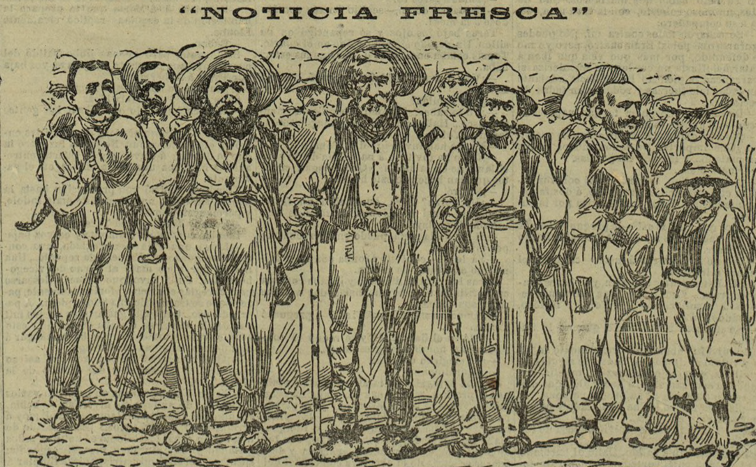
Hace días que aparecieron en esta Corte los acreditados segadores gallegos.

Cuatro palabras sobre ese matrimonio. Es la cosa más corriente. El Papa, usando las facultades indiscutibles que tiene y por ningún canonista negadas, ha dispensado esta vez, como lo han hecho otras sus antecesoras, no precisamente del voto de castidad, que los curas no hacen al ordenarse, sino de la promesa de obediencia a la Iglesia, en cuya virtud no se casan, porque ella se lo prohíbe con el mismo derecho que puede permitírselo; esto es todo, y por ello se dice que el or-