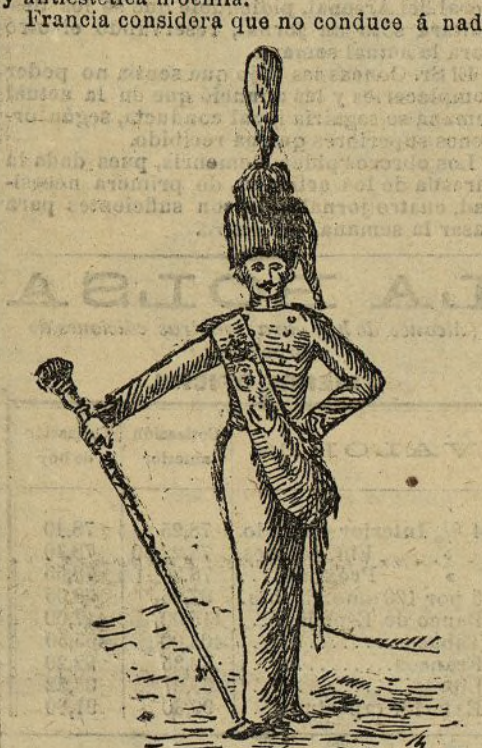
El tambor mayor español "Bachicha"

práctico privarse de unos cuantos millares de soldados capaces de combatir por respetar viejas tradiciones. Entre los marciales golpes de parche, necesario antes de épocas pasadas, cuando el valor individual podía por sí solo llevar al triunfo, siendo el choque de masas principal factor de él, y los estridentes silbidos del pito de señales suficiente para disciplinar el fuego, enviando aludes de proyectiles los agazapados combatientes, la opinión general se decide por el último.