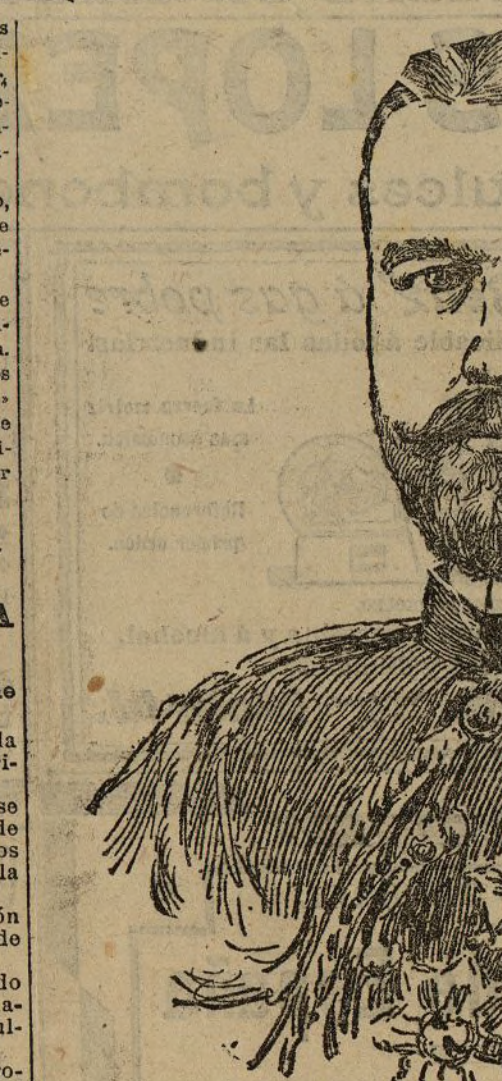
NUEVO GENERAL DE BRIGADA DON GUILLERMO PINTOS

Según parece, entre ambos existían antiguos resentimientos.—Mariano.