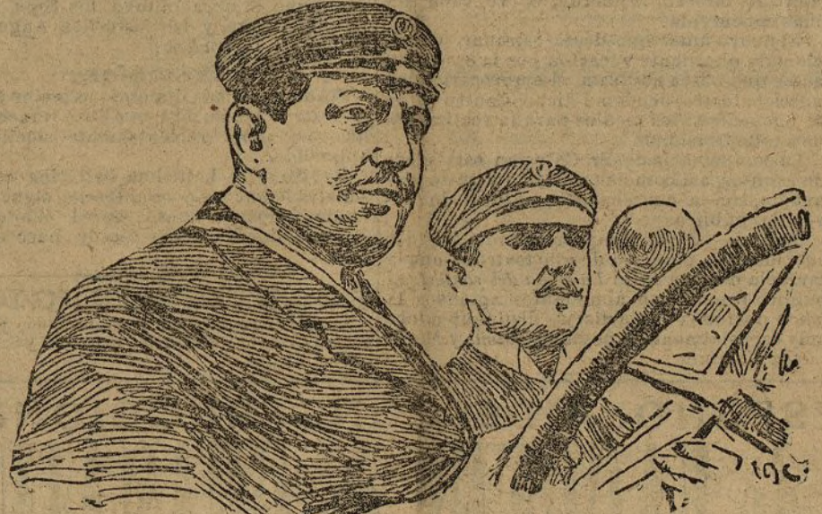
Thery y su charrifour

Ya está proclamado el vencedor. El francés Thery, en un coche Richard-Brasier . Las cuatro vueltas del circuito de Auvergne las ha hecho empleando siete horas y diez minutos, ó sea una velocidad media de 78,550 kilómetros a la hora. No tuvo prisa ninguna, lo cual, en rigor de verdad, no es poca suerte.