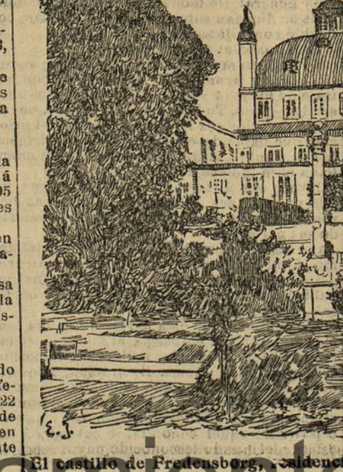
El castillo de Frontenborg, residencia de verano de la familia real de Dinamarca