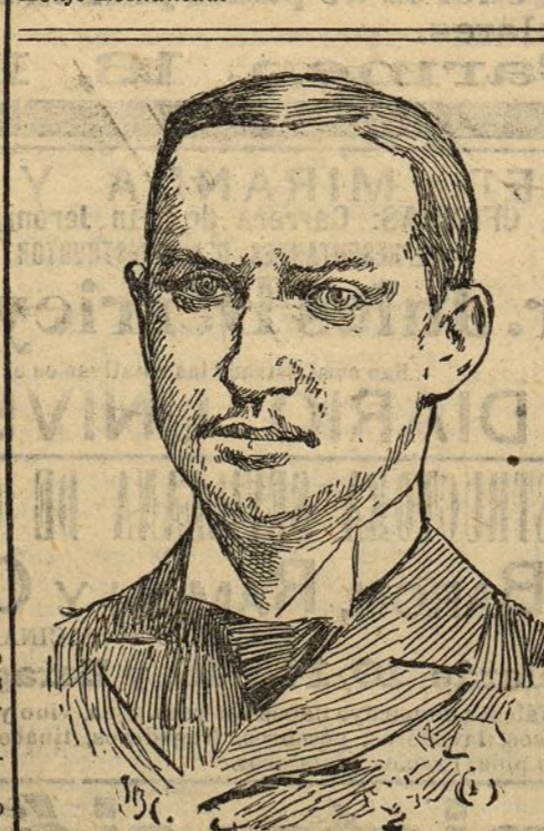
El príncipe Carlos de Dinamarca, futuro rey de Noruega