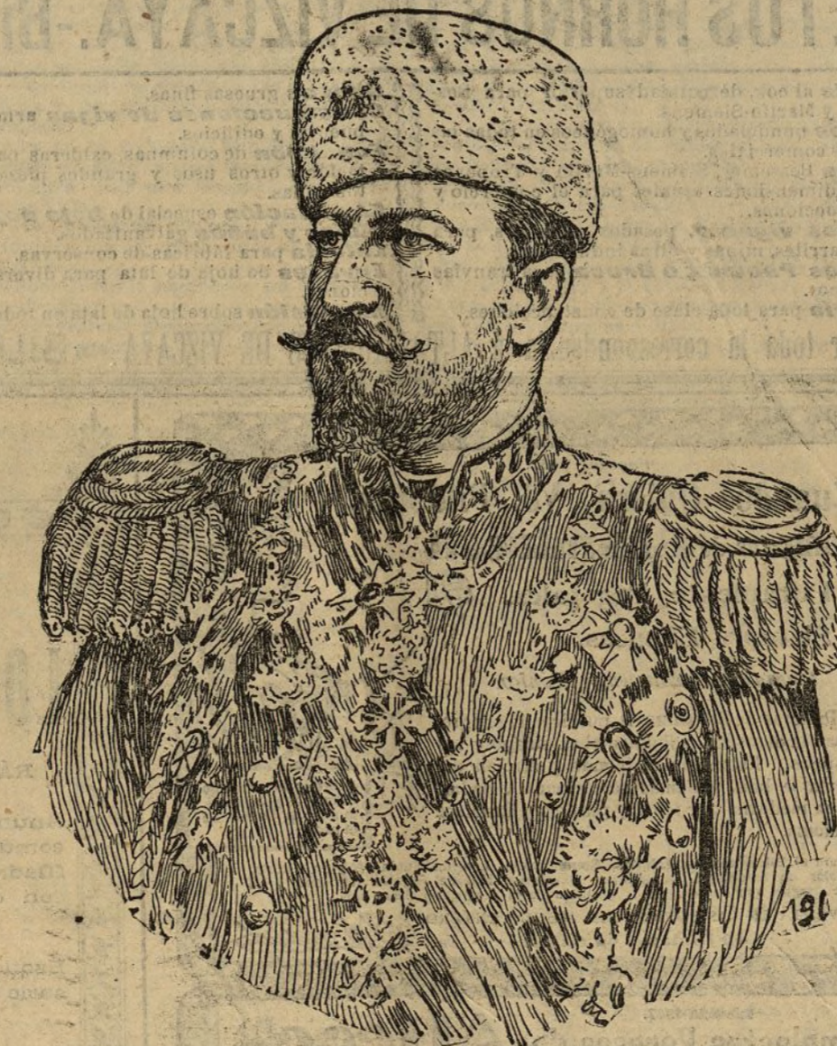
El príncipe Fernando, proclamado rey de Bulgaria

Hasta el fin del semestre próximo pasado de este año los ingresos de la Compañía ferroviaria del Norte han sido de 49.330.479,22 pesetas con 51.901.443,21 de igual período de 1904, acordado, por consiguiente una baja en la recaudación del presente año importante a 2.570.964,43 pesetas.