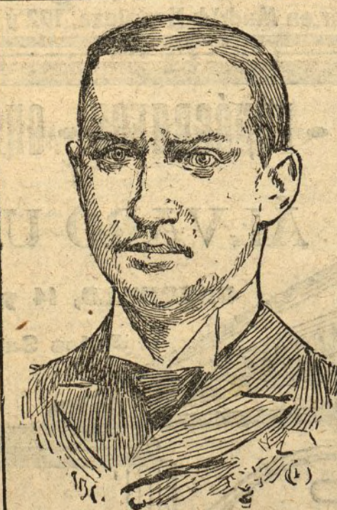
El príncipe Carlos de Dinamarca, futuro rey de Noruega