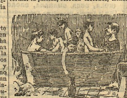
Un baño de familia

Las albercas están en buenas condiciones. Tienen unos ocho pies de profundidad. Para formar la piscina, colocan tabloncillos, llenan-