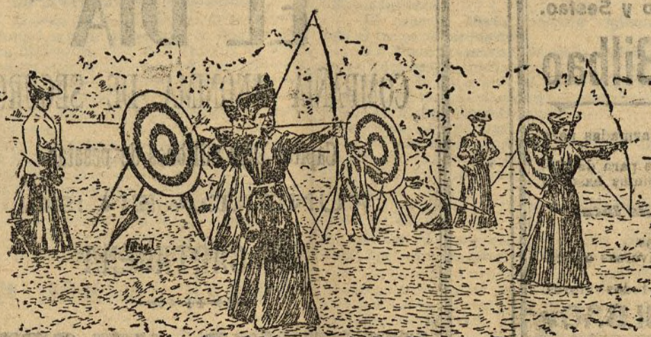
Miss Leigh, vencedora en el Concurso de la Flecha de Oro en Compiegne