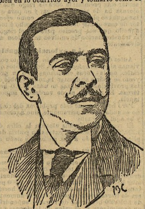
El maestro Villa

La Sociedad de Conciertos debe reparar bien en lo ocurrido ayer y tomarlo como es-