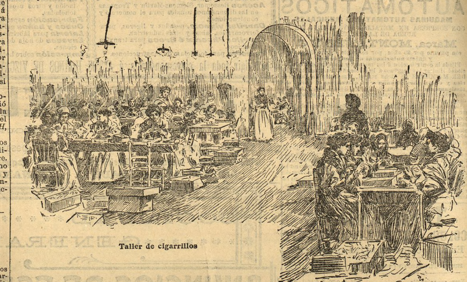
Taller de cigarrillos

A la una y media de la madrugada el fuego estaba en todo su apogeo.