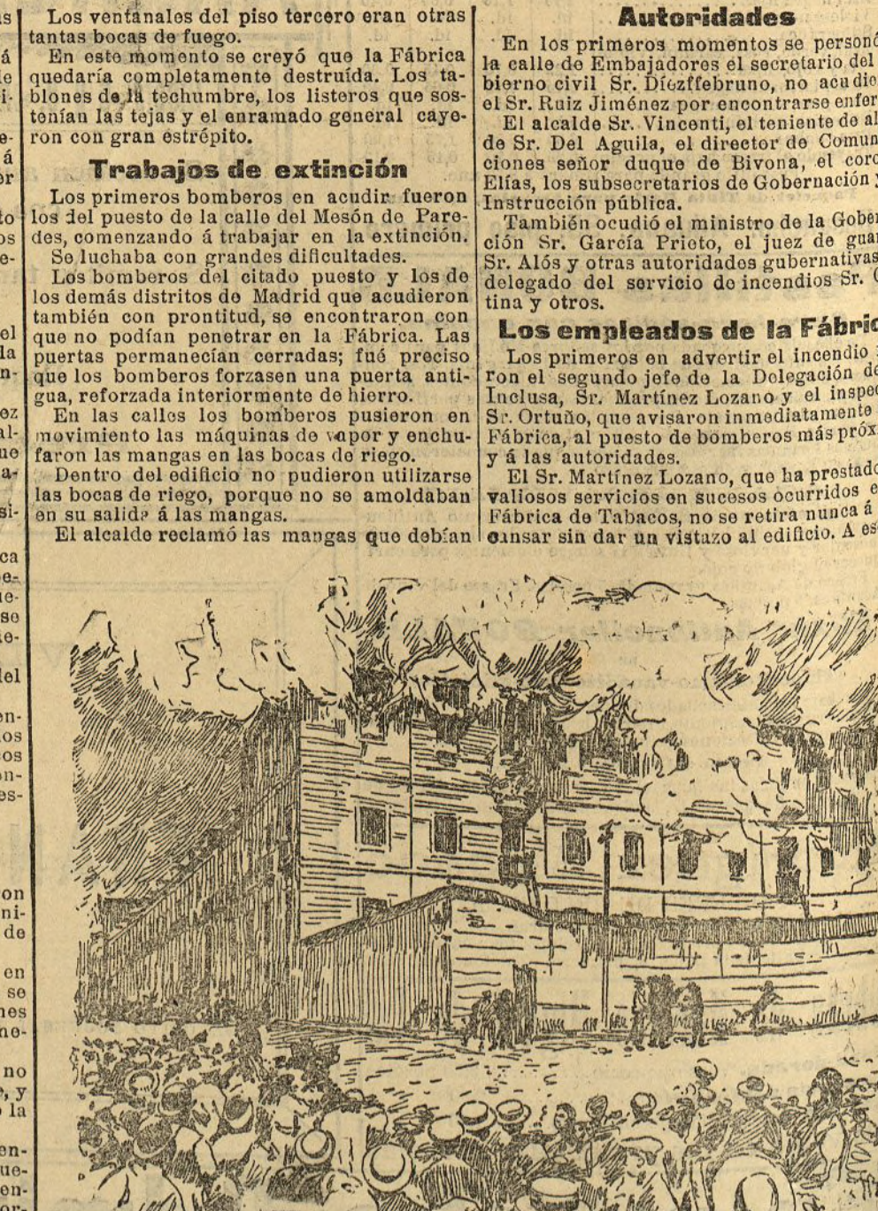
La Fábrica de Tabacos ardiendo