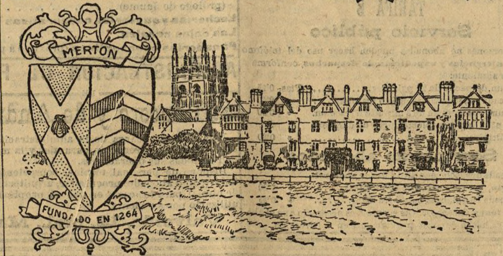
Las armas y el Colegio de Merton en Oxford, fundado en 1264

Tenía que visitar en Oxford a un amigo estudiante en aquella famosa Universidad inglesa, y salí de la estación de Paddington en un tren expreso de la mañana, que en hora y cuarto me llevó a Oxford.