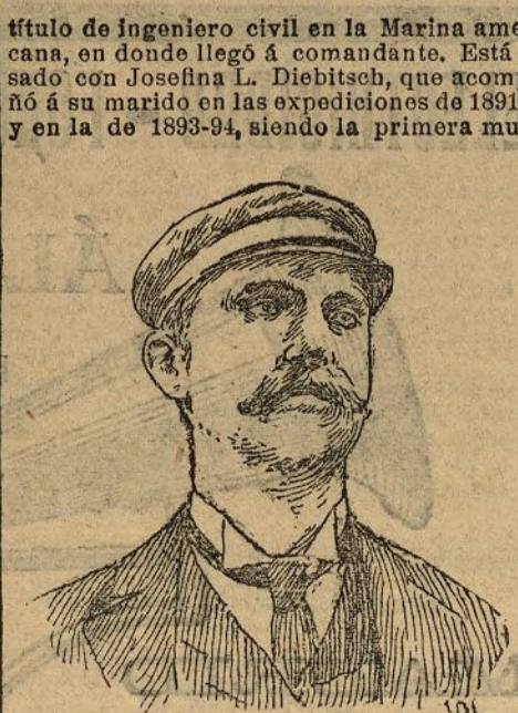
El comandante Peary

Para que se perdonen al continente las faltas de urbanización, de limpieza, de belleza, de orden, y se perdonen al vecino sus faltas, que son muchas, que encanto hay en esta gente! Hay el angel , que no se