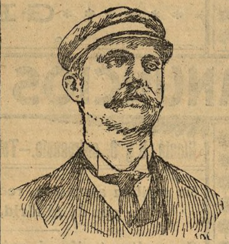
El comandante Peary

Para que se perdonen al continente las faltas de urbanización, de limpieza y de belleza, de orden, y se perdonen al vecino sus faltas, que son muchas, ¿qué encanto hay en esta gente? Hay el ángel, que no se