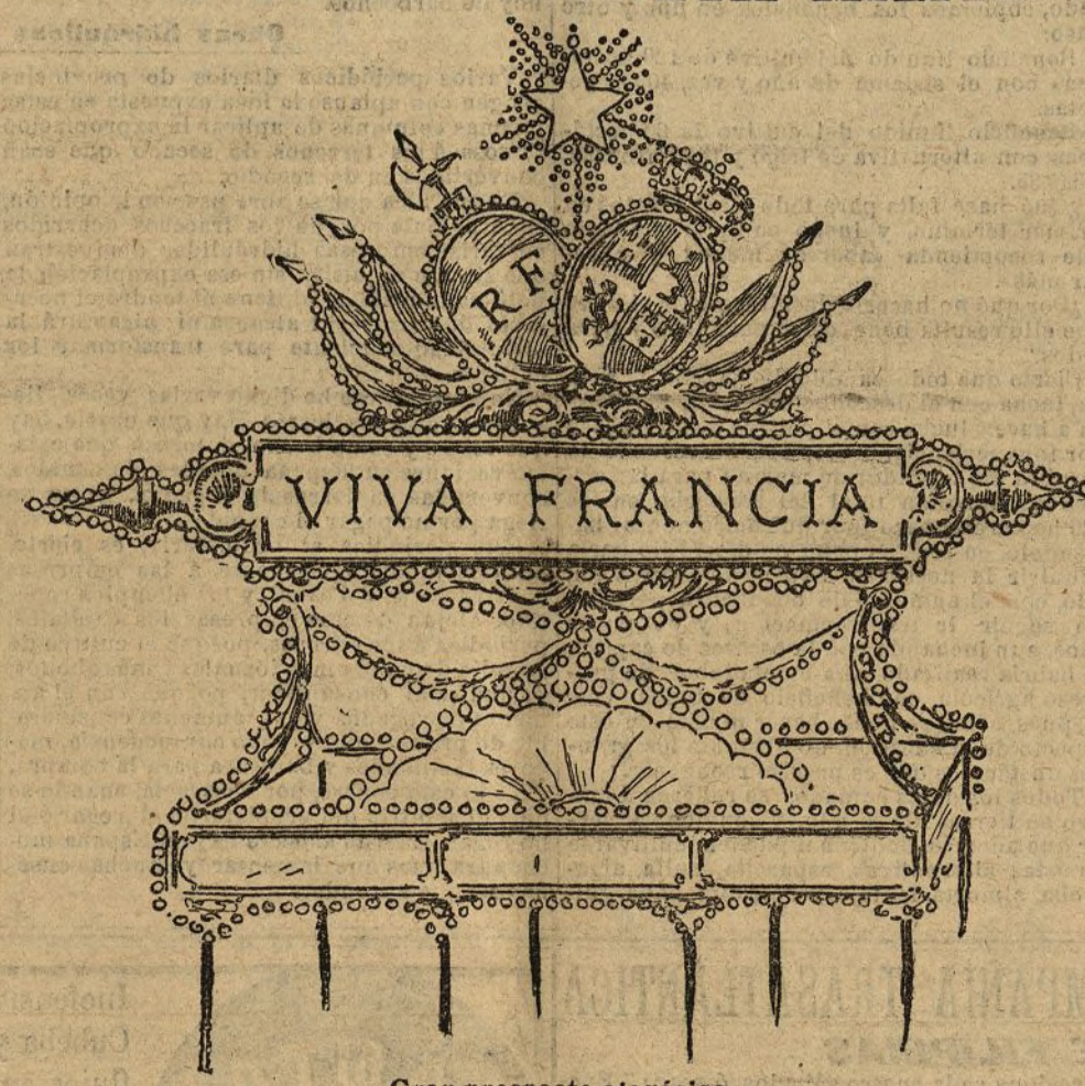
Gran prospecto alegórico

Con el beneplácito de S. M. el rey y del Gobierno se ha aprobado el proyecto de retreta militar propuesto por el alcalde para las fiestas que en el mes de Octubre se celebrarán en honor del presidente de la vecina República.