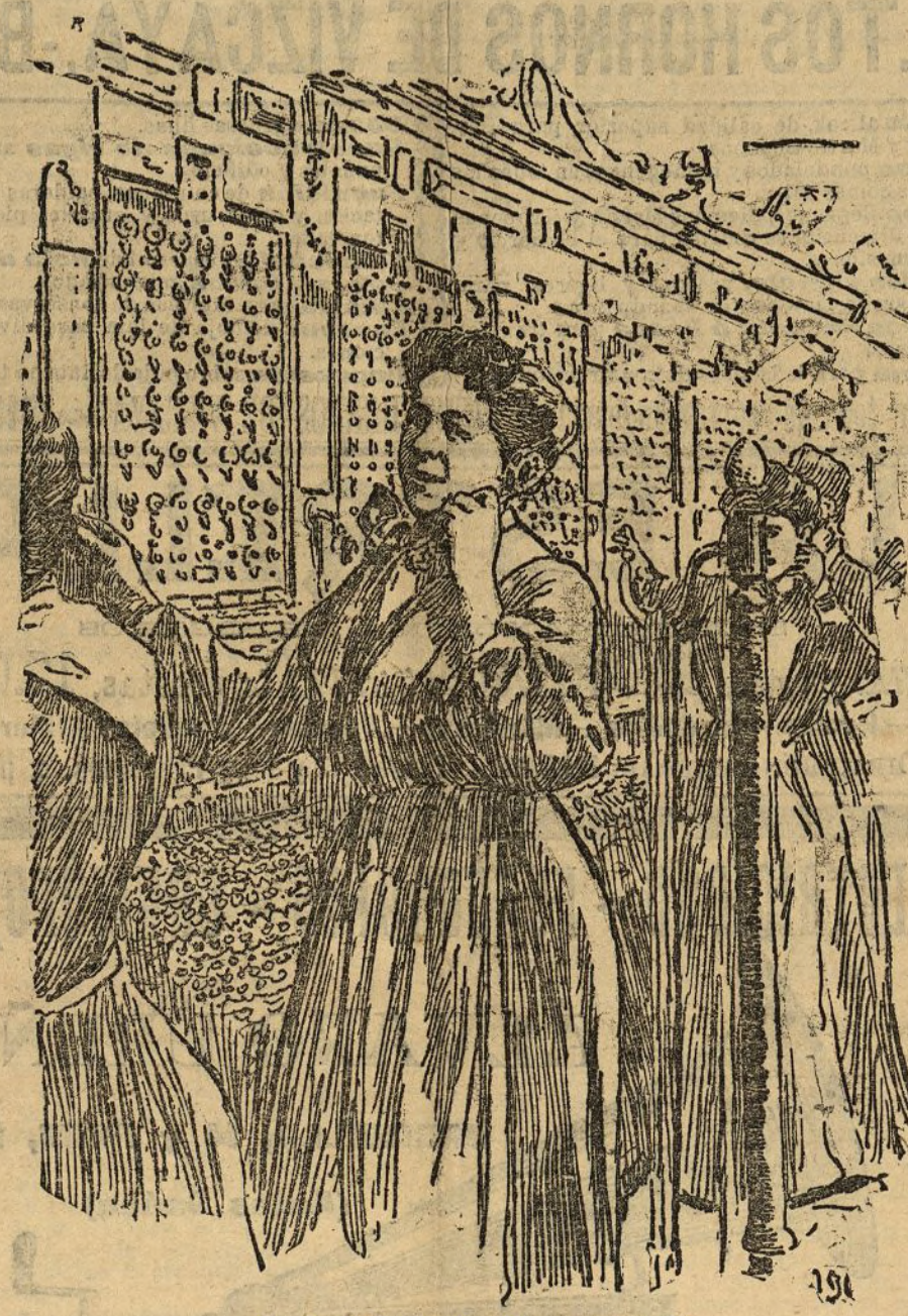
Central Comunicación con el 1571

La noticia oficial, la orden de Bolsa, el incendio que amenaza destruir una manzana de casas, la catástrofe que ha ocasionado centenares de víctimas, el resultado de una elección, todo cuanto es manifestación o consecuencia de la vida moderna en las grandes capitales, llega a conocimiento del público por medio del teléfono.