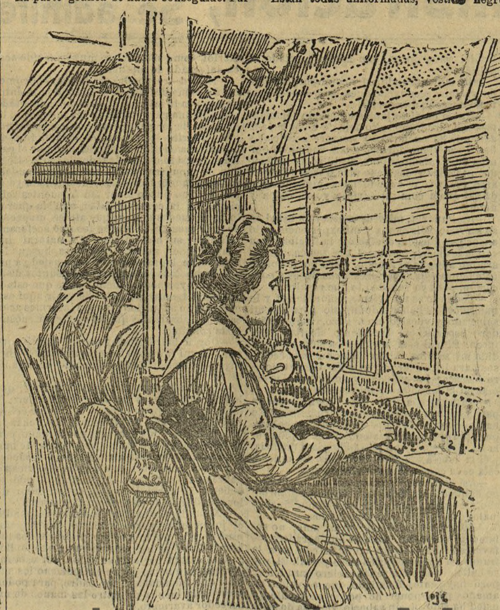
Las telefonistas en el aparato «Nuevo Múltiple»

A eso tira, ese prejuicio lleva el Congreso de Strasburgo, cuyas discusiones, por mera fórmula verificadas, pudieran haberse ahorrado los nueve odores (uno de ellos español), insertos en el programa y a los cuales yo, querría oír dilucidar en menos académica pero más por-