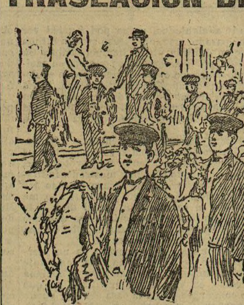
Escolares conduciendo las coronas