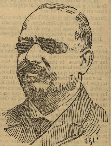
D. Valentín Lamas Carvajal

Tiempos remotos. Primeras obras en gallego. Siglos de esplendor. Decadencia. Recrudescencia del renacimiento. Pintos, Añón, Camino, Ponzal, Rosalía de Castro, Lamas Carvajal, Barcia Caballero y Murguía. Para hacer completo el estudio de la literatura de Galicia no podría prescindirse de empezar por la época romana, en la que florecieron escritores como Ildico y Orosio, que aunque escribieron sus obras en latín, dieron tanta gloria a la región a que pertenecían. Las producciones literarias eran entonces