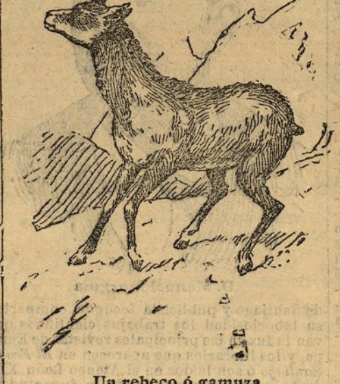
Un rebeco ó gamaza

El día de hoy ha amanecido espléndido, y han salido el obispo de Salamanca, el padre