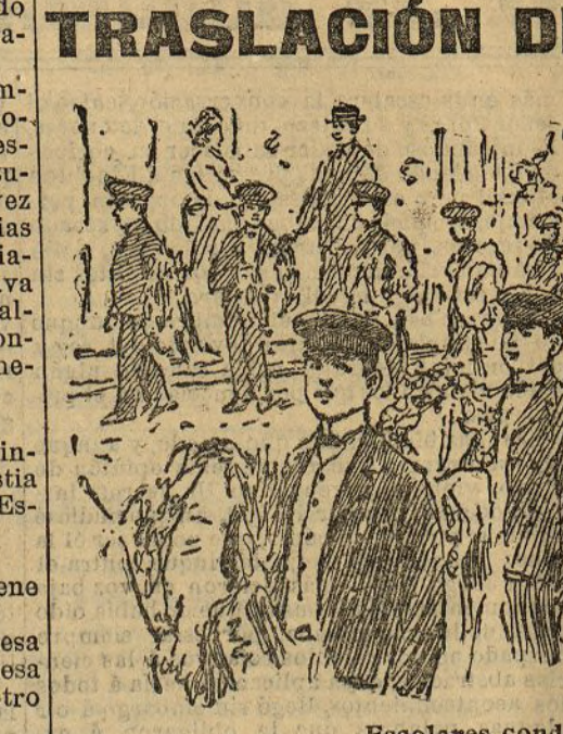
Escolares conduciendo las coronas

El canal de Alquízar Dentro de pocos días se inaugurará el canal que la Sociedad inglesa intitulada The Alquízar ha construido en la sierra de Geres, provincia de Granada. El acto, á que están invitados los elementos oficiales de la Geres, Lanteira y Alquízar, tendrá gran importancia.