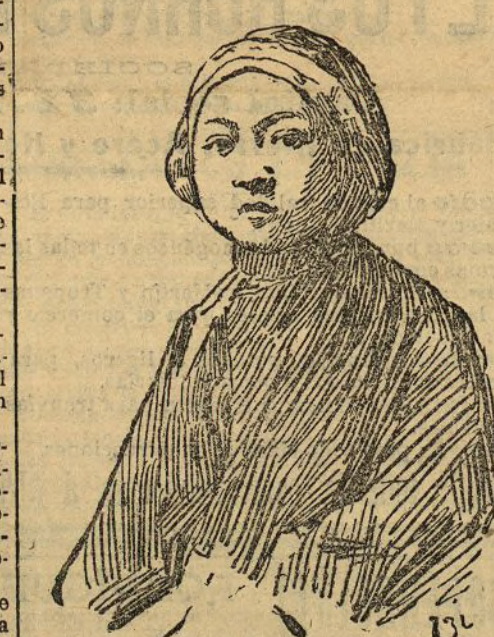
Una esclava china

Con eso hay bastante, no sólo para hacer una, sino varias buenas temporadas, y lo seguro es que nadie ofrecerá más ni más interesante novedades. —R.