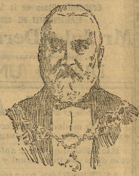
D. Joaquín González de la Peña ministro de Gracia y Justicia