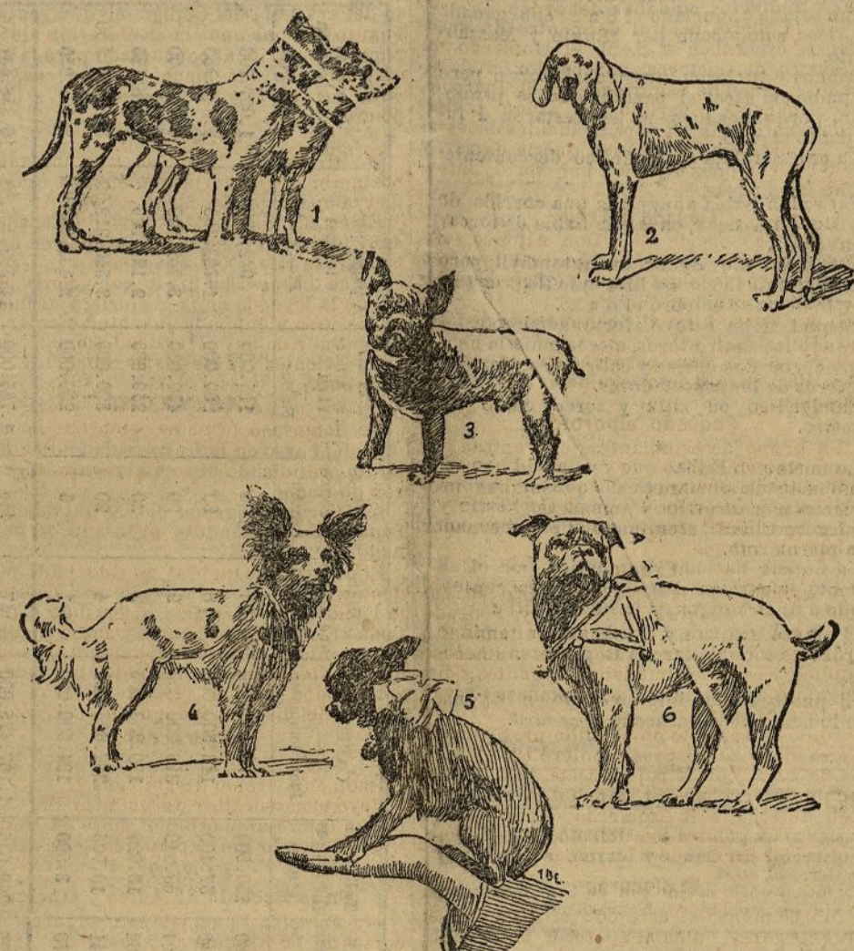
1. César y Flora, daneses pintados, primero y segundo premios.—2. Dick-Duck, pación de raza, primer premio.—3. Tac, bulg. francés, primer premio.—4. Marquesa, raza mariposa, premiada.—5. Toby, dogo ruso, premiada

La Sociedad central que preside el principal de Vagnan, y que cuenta entre sus socios más entusiastas al príncipe de Aramburg, duque de Gramont, duquesa d'Uzès y otros muchos sportmen y cazadores franceses, obtuvo un triunfo merecidísimo y felicitaciones de cuantos presenciaron la última Exposición canina celebrada en París recientemente.