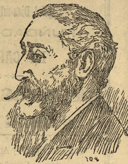
D. José María Heredia

ese círculo de magia donde sonríen, pensativas, las duquesas que sonó Stendhal.