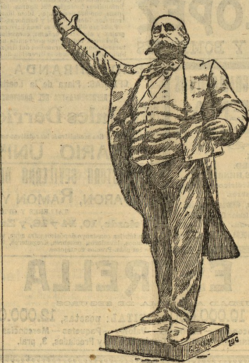
La estatua de Castelar que hoy se ha inaugurado en Cádiz.

La opinión elogia al Gobierno y a las autoridades locales, que tan activamente han trabajado en favor de la necesitada clase obrera. — Carlos