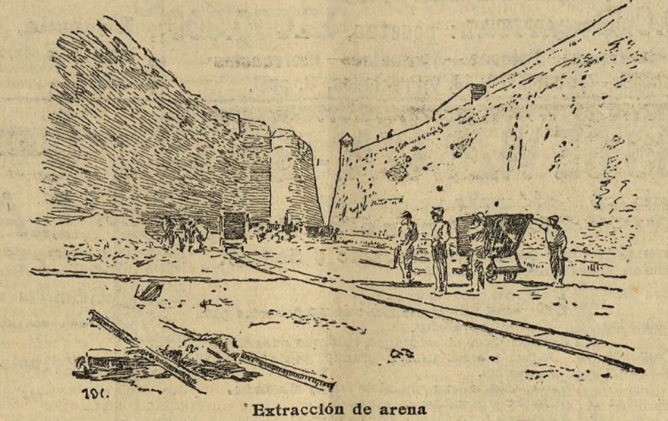
Extracción de arena