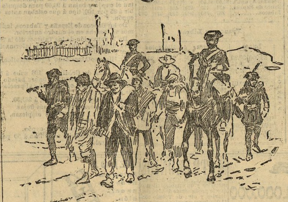
Conduccion de presos por tránsitos ordinarios

Por toda la Prensa ha circulado estos días la noticia de que entre los aumentos que el actual Gabinete presentaría en los presupuestos figura uno destinado a dar un real más de haber diario al guardia civil.