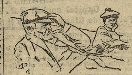
Mr. y Mme. Carnegie

Lo mismo que Roosevelt, gusta hablar de las cuestiones políticas y religiosas, y sus ideas so-