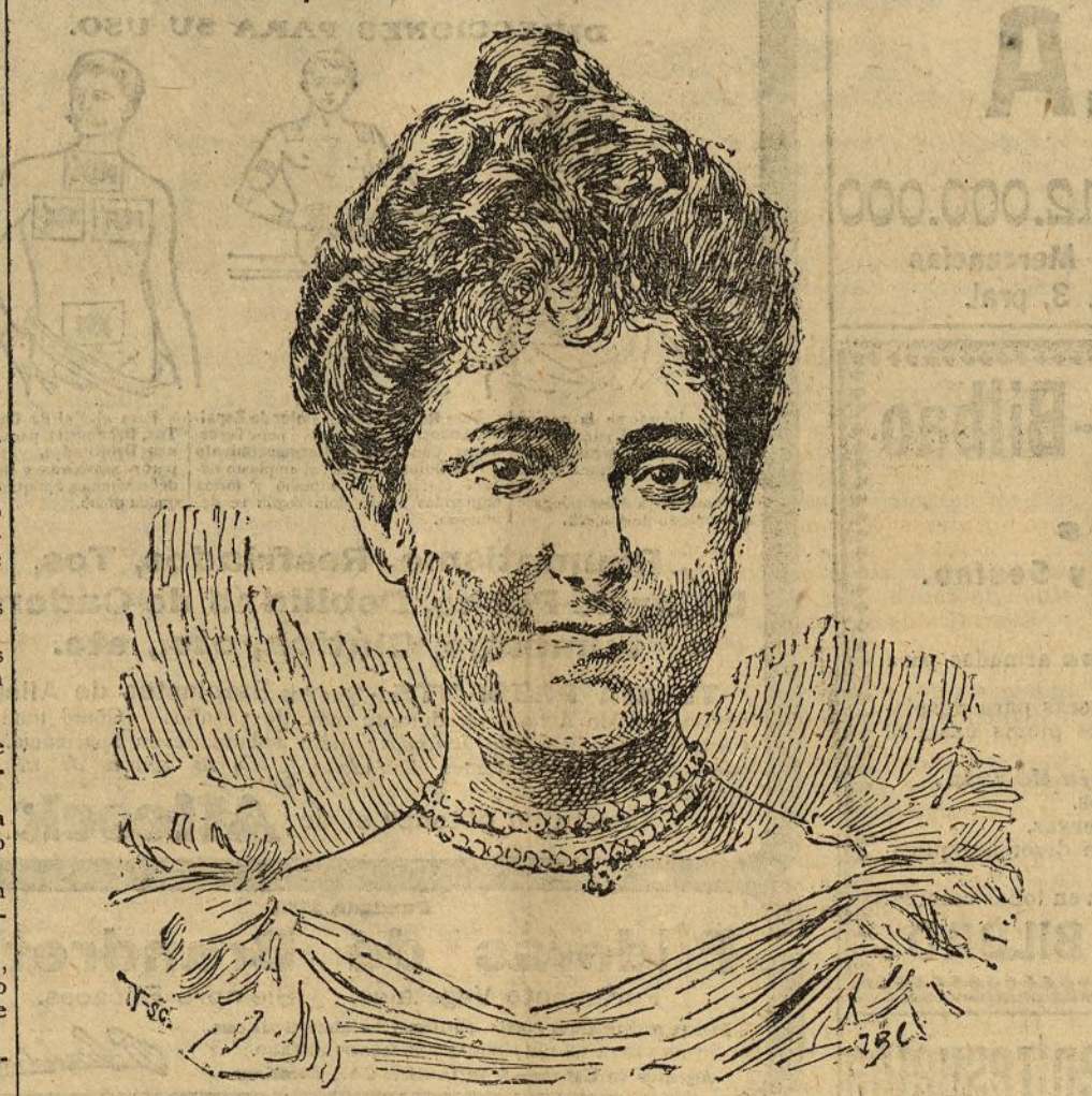
Primer aniversario de su fallecimiento