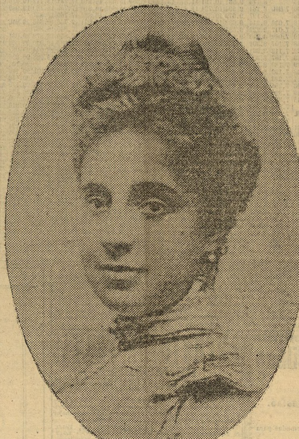
S. A. LA INFANTA MARÍA TERESA

El primer paso para el anunciado enlace de la infanta Doña María Teresa con el príncipe Don Fernando de Baviera, se ha dado esta mañana con el acto de la naturalización española de dicho príncipe, su nombramiento de capitán de Húsares de Pavia y la imposición de las insignias del Toisón de Oro, collar de Carlos III y gran cruz de Isabel la Católica, que son los grados superiores que le corresponden de dichas Ordenes como infante de España.