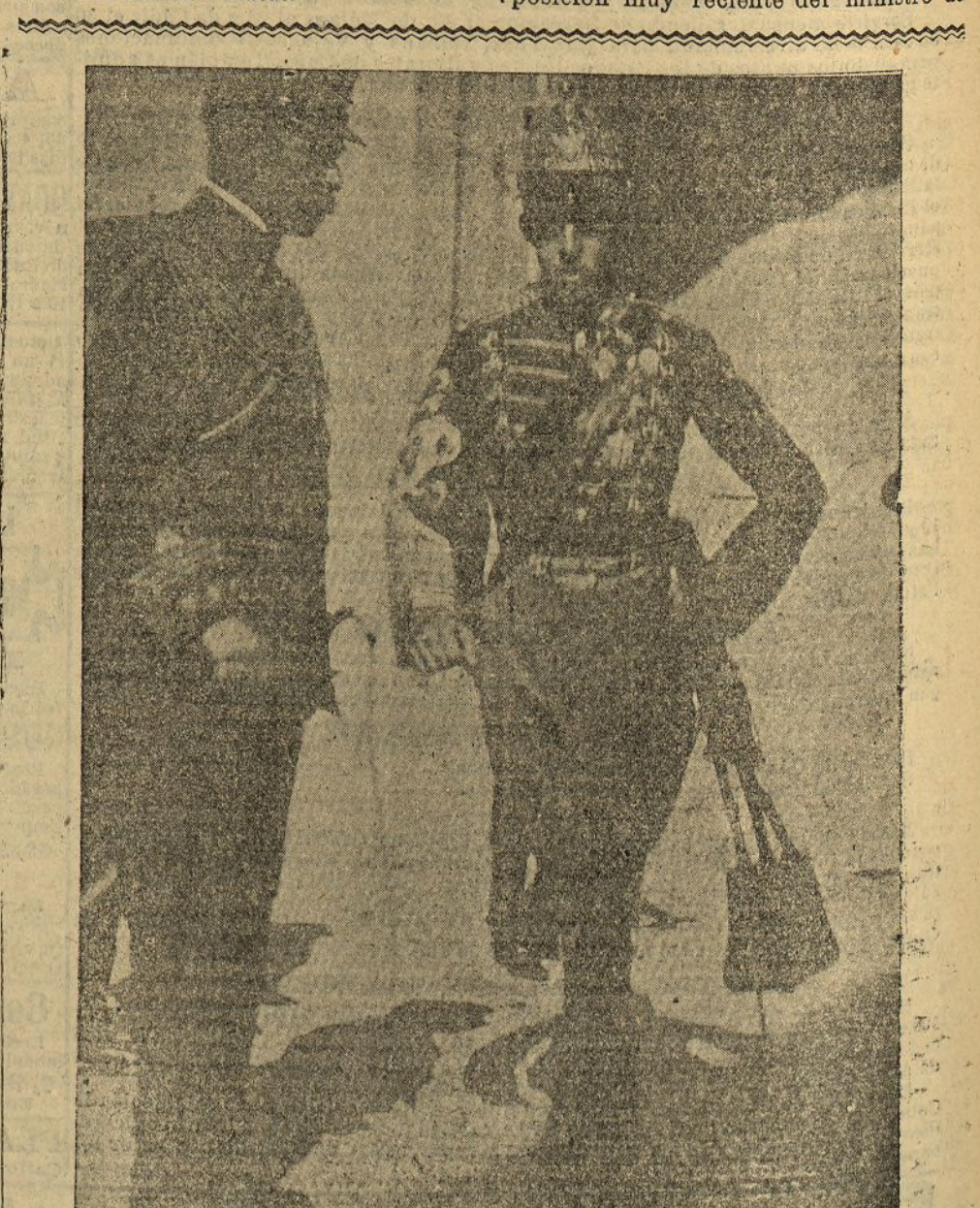
El rey en el patio de Palacio en el día de hoy