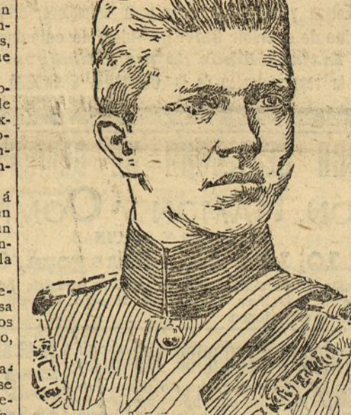
El príncipe Fernando Maria de Borbon para dirigirse a la capilla donde se hallaba el infante Don Fernando.

Terminada la ceremonia de petición de mano, el rey descendió a la planta baja de Palacio por la escalera interior del mismo