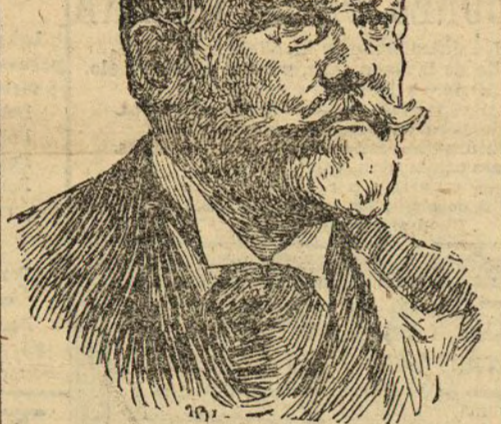
Sr. León y Castillo embajador de España en París durante muchos años, llegado anoche a Madrid

Y el tratamiento suero no es nocivo sobre el niño, pues actúa con ventaja sobre la evolución de las diversas afecciones de la infancia, enteritis, bronquitis, etc., etc.