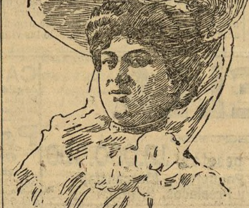
EXPOSICIÓN FOTOGRÁFICA.—Retrato de señora, por Compañy

No cabe duda: el peligro amarillo nos amenaza. Empezamos por tomar los juegos japoneses, y concluirán éstos por tomarnos la casa.