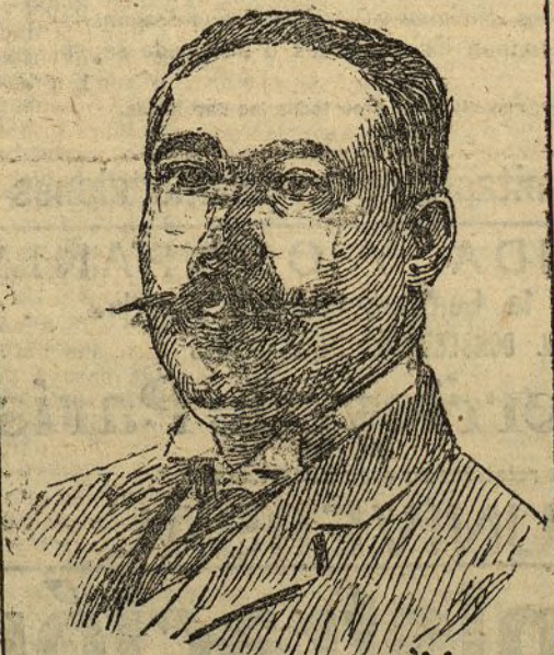
D. Cándido Carrasco y Diaz alcalde de Jaén