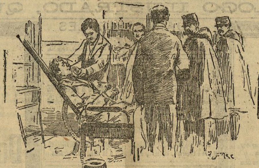
En la Casa de Socorro. Dándole el amonico a un alcohólico

En Suiza la bella señora de Bormio, que se propone pasar el invierno en dicho punto. —R.