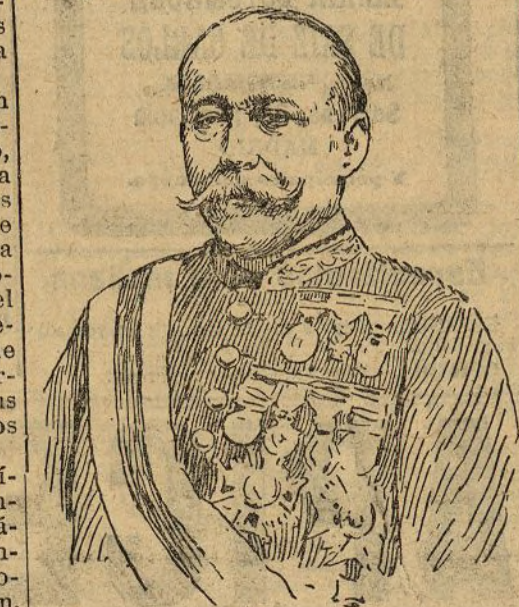
El general Polavieja presidente de la fiesta de anoche

La mesa presidencial estaba dividida en tres trozos: el central destinado á la presidencia, propiamente dicha, y los laterales á las altas representaciones civiles y militares. A la izquierda del general Polavieja estaban el general Echagüe, el Sr. Canalejas, general Orozco, D. Mariano de Cavia, general Aznar,