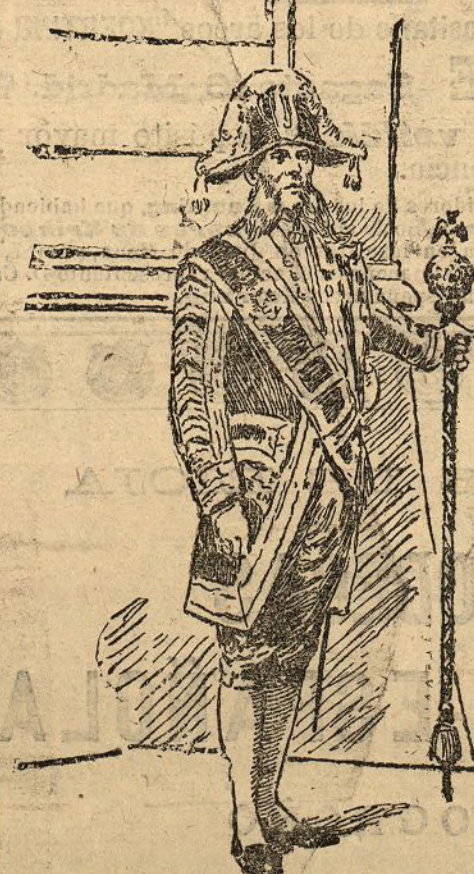
Portero del Palacio Imperial de Viena

Momentos antes había llegado de Berlín un tren conduciendo a los personajes oficiales que habían de despedir al rey de España. Don Alfonso se despidió de todos en término.