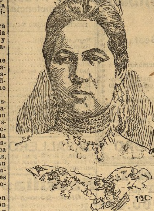
La archiduquesa Isabel

— Viena 13. No bien terminó la recepción de los españoles en la Embajada, Don Alfonso se dirigió a la iglesia de los Capuchinos.