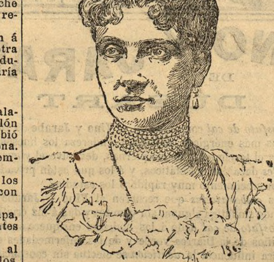
La archiduquesa Maria Josefa

puestos que debían ocupar en la mesa, en la cual todos se sentaron a los acuerdos de la música.