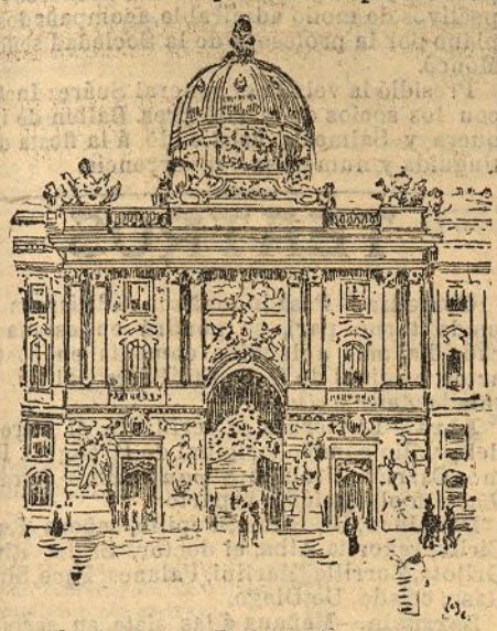
Fachada del Palacio Imperial

Todas las damas de la Corte asisten a la función, y la nobleza de Viena, que ha abandonado sus castillos y cazaños para recibir