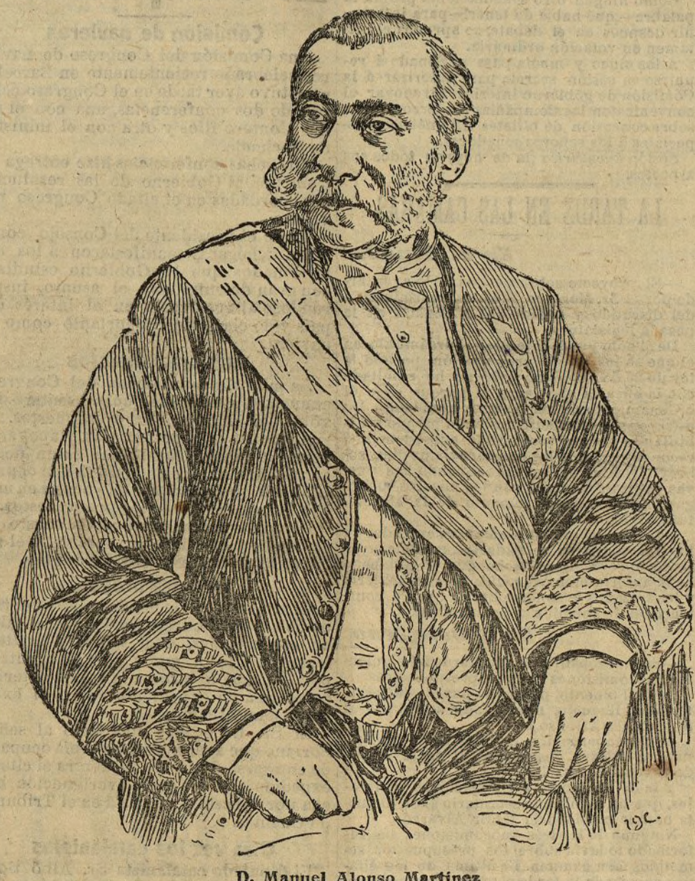
D. Manuel Alonso Martínez

Hace cincuenta años que siendo ministro de Fomento D. Manuel Alonso Martínez, el 1.º de Septiembre de 1855, se dictó el decreto fundando la Escuela Central de Agricultura. Fue una iniciativa laica, un suceso de avance en el mejoramiento agrícola de España, y el Cuerpo Nacional de Ingenieros Agrónomos, noble y agradecido, con solicitud que le honra, y espíritu que le enaltece, ha querido conmemorar fecha tan señalada y rendir el debido tributo a la memoria de aquel patriótico insigne, preparando al efecto algunos actos y solemnidades.