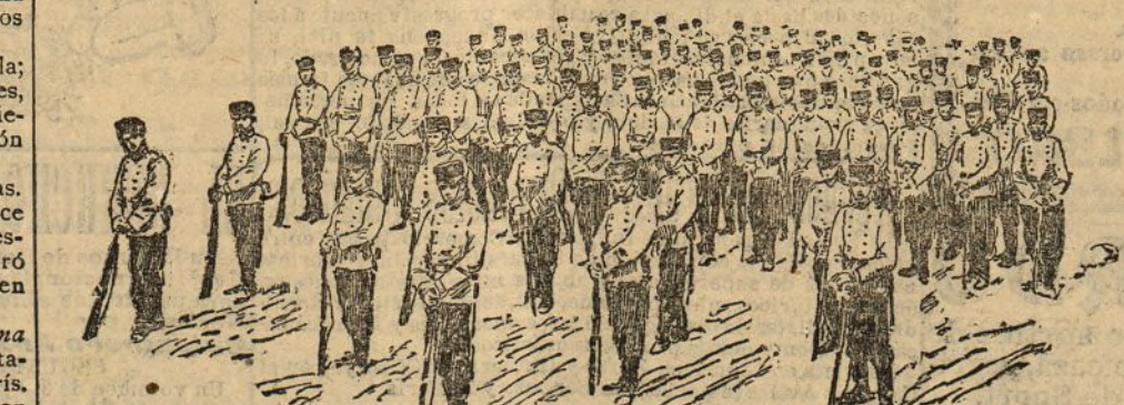
Compañía de alumnos

Recuerdo que al ser habilitado el templo de San Isidro, de esta corte, para catedral provisional, se dispuso arreglar una gran estancia donde el personal se reuniese a charlar ó descansar. Al mo-