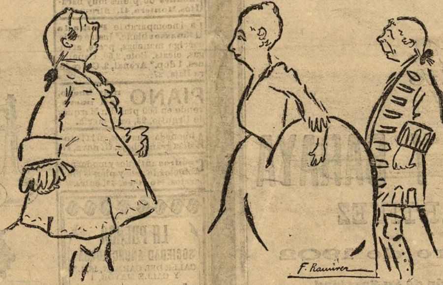
Díaz de Mendoza (F.), María Guerrero y Díaz de Mendoza (M.)