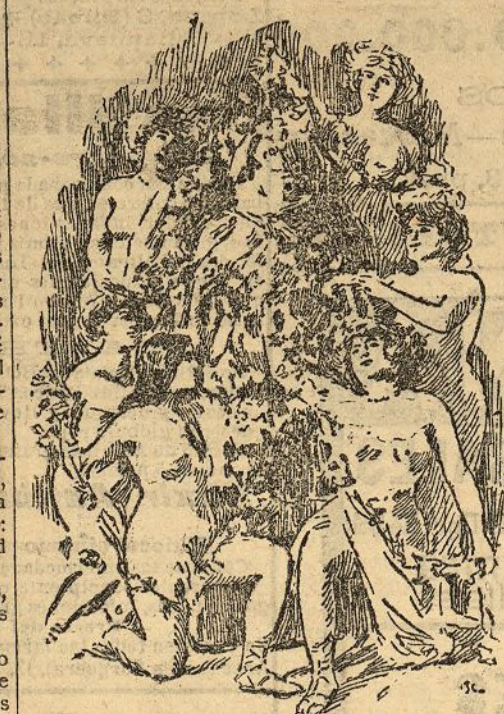
El ciclo del cabaret

con risas, demasiado sonoras á veces de puro forzadas. Se ha pensado, sin embargo, en la tensión de vuestros nervios y cerca de allí os espera Le Chat . Es la caricatura más grosera de la corte celestial. Un gordo San Pedro, provisto de colosal llave, os abre la puerta; angelitos panzudos con enormes pelucas rubias; un San Agustín predicando en el púlpito; un San Antonio de sucos