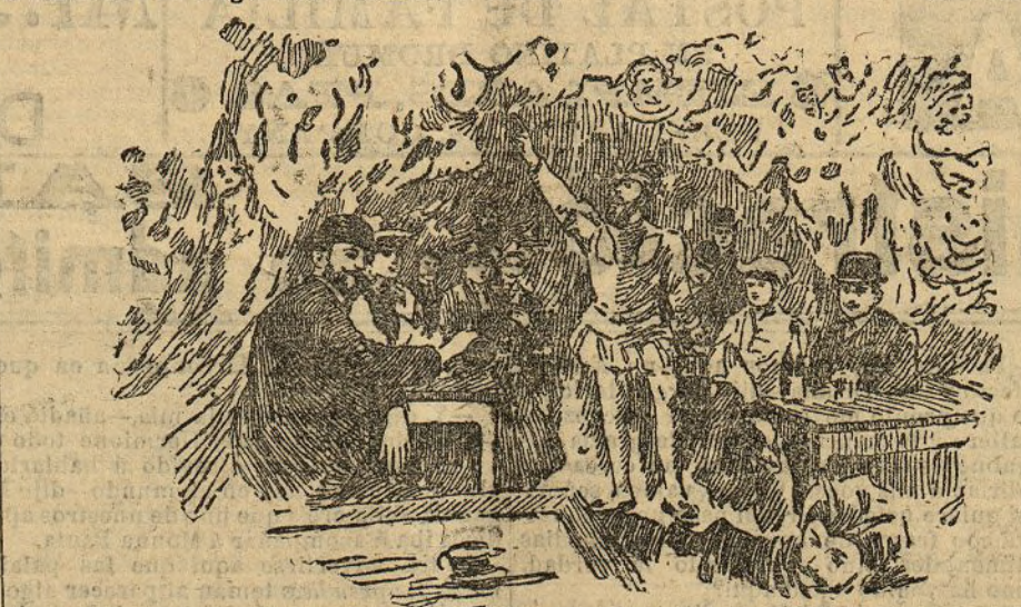
El cabaret del infierno