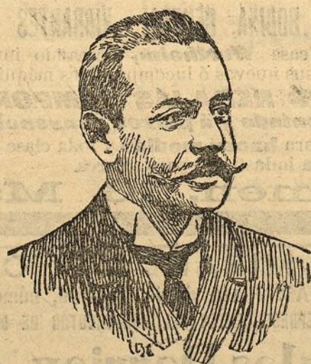
Sr. Duque de Bivona nuevo gobernador de Barcelona

En el orden económico como en los demás de la vida del Estado, sus soluciones no son improvisación; en el correr de los años las ha meditado y las ha expuesto en discursos, en escritos y en proyectos de ley. La sinceridad en prometerlas no es arrogancia, sino convicción. Tengan todos el suficiente patriotismo para ser justos en las palabras y en los hechos, y entonces, del fracaso de esos propósitos, sólo al Gobierno podrá imputarse la responsabilidad, mientras la gloria del triunfo será para todos.