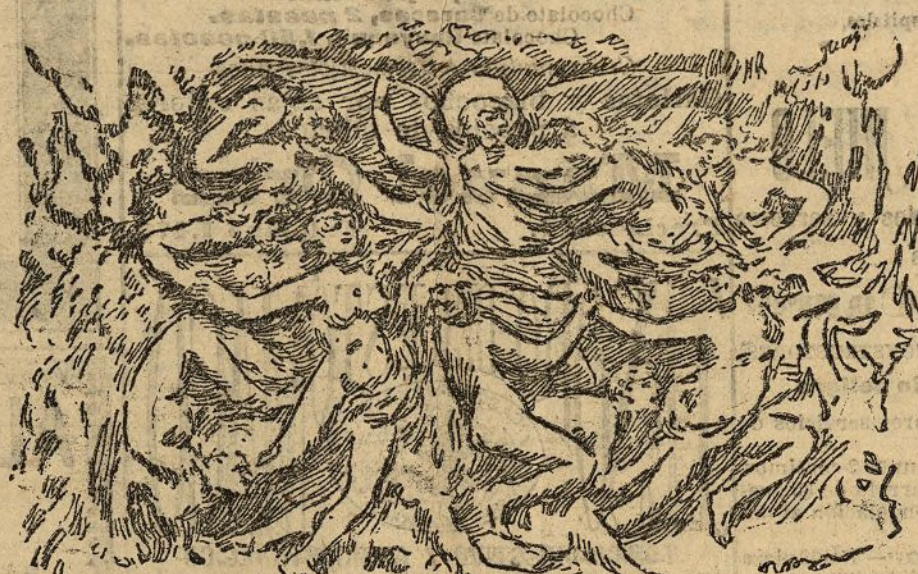
Un relieve del cabaret del infierno

El Gobierno del Japón ha acordado aumentar su ejército efectivo en cuatro divisiones. Veinticuatro millones de yenes se han consignado en los presupuestos para este objeto.