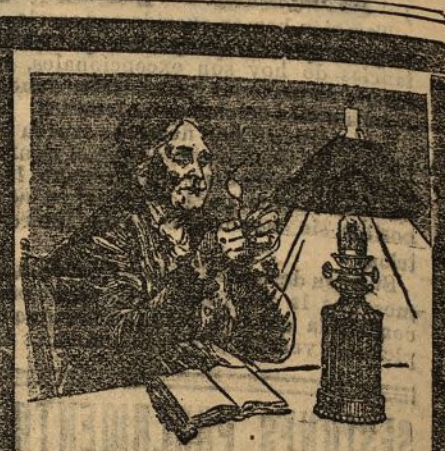
Cuando la lámpara de la vida empieza a bajar

LA JOYITA Compra oro y plata a altos precios y reformo toda clase de alhajas. Príncipe, 8.