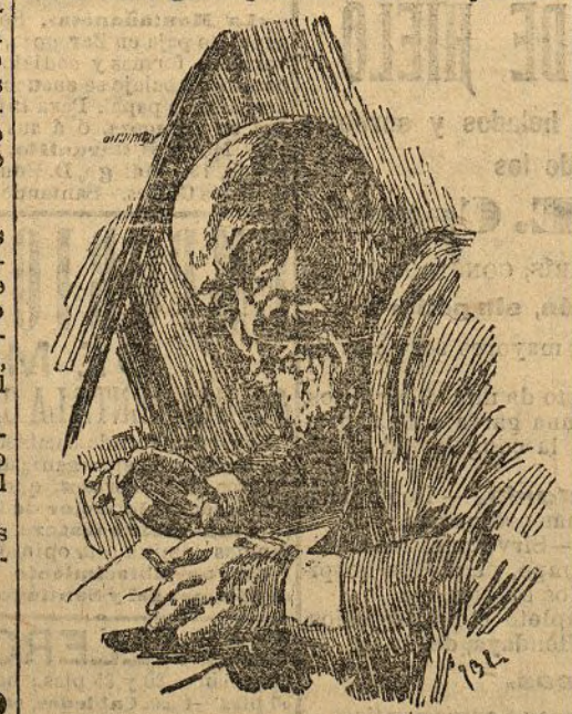
Excmo. Sr. D. Ricardo de los Ríos

A la inauguración del saloncito del Circolo de Bellas Artes, donde se ha instalado la Exposición de grabados y esculturas, éstas en poco número y nada sobresalientes, acudió un distinguido público de artistas y aman-