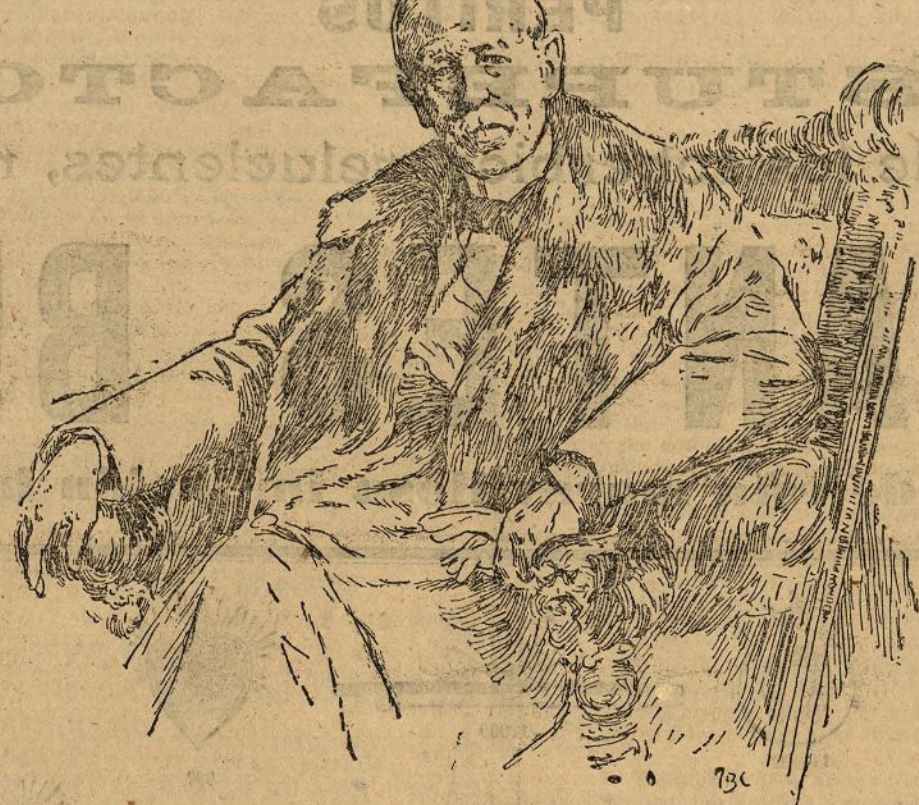
El marqués de Cayo del Rey (Retrato de Moreno Carbonero.)