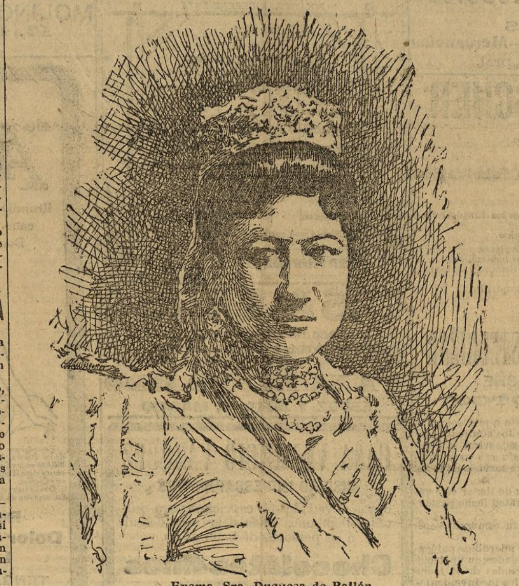
Excm. Sra. Duquesa de Bailén.

En el palacio de la señora duquesa de Bailén