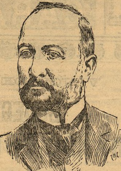
D. Angel Galarza nuevo director general del Instituto Geográfico y Estadístico.