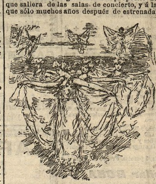
Baile de las Siñides

Maestros de indiscutible autoridad en la materia entienden que la ópera no ha ganado nada al llegar a la escena con todos los aditamentos propios de la escenografía, y vistas las cosas desde las alturas de una estética de más refinada, es muy posible que tengan razón: pero aun admitiendo eso, es innegable que Gunsburg y los que ahora popularizan, como la empresa del Real, la ópera de Ber-