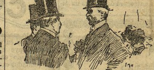
ALGECIRAS.—El embajador de los Estados Unidos conversando con el alcalde

Francia pedirá libertad de acción para reprimir el contrabando en la frontera argelina.